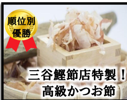
三谷鯉節店特製! 高級かつお節

★大会賞品は、様々な状況により、やむを得ず予告なく変更する場合がありますので予めご了承ください。