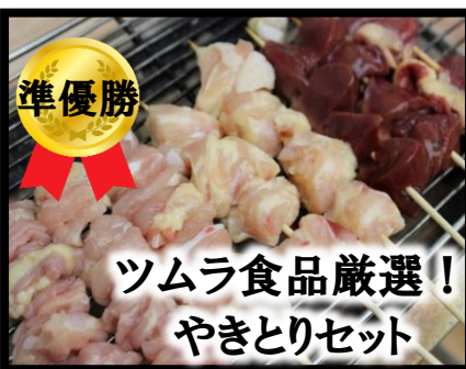
ツムラ食品厳選! やきとりセット