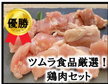
ツムラ食品厳選! 鶏肉セット