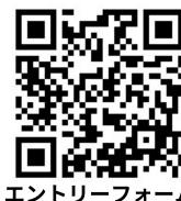
エントリーフォーム

☆締切後のキャンセルにつきましては、参加費をお支払い頂きます。 ☆来場制限・会場地図を必ずお読みください。