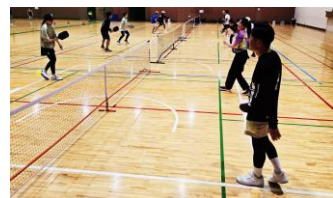
室内コートでプレイ