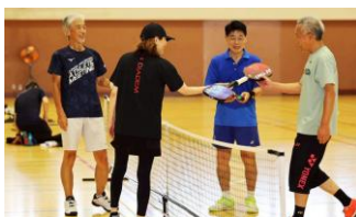
楽しい趣味が見つかる！