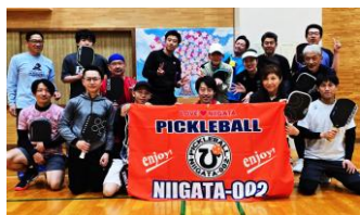
世代を超えて楽しめる！