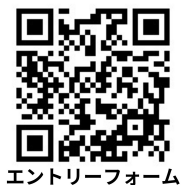
エントリーフォーム

☆締切後のキャンセルにつきましては、参加費をお支払い頂きます。 ☆来場制限・会場地図を必ずお読みください。